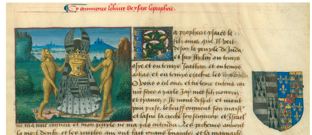
Ex-libris héraldique, fragment d'une Bible historique aux armes de Jean de Derval et d'Hélène de Laval, XV e siècle (coll. part.).