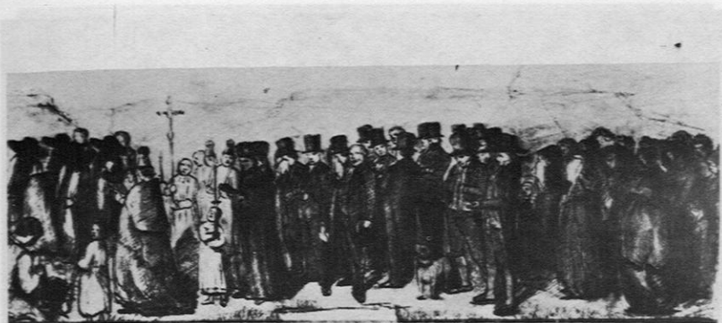
Fig. 5. — Courbet: «Un enterrement à Ornans» (1849) (dessin).

Regardons sa «Fileuse endormie» (40), peut-être la toile exposée à Paris en 1857, qui reprend le sujet que Courbet exposait en 1853; la matière en est riche, la gamme recrée une atmosphère intimiste simple et sans fadeur, mais la sensualité que Courbet introduit dans un tel thème est absente; Antigna est beaucoup plus proche des peintures intimistes contemporaines de Millet (comme «le Sommeil de l'enfant» ou «La leçon de tricot») à la fois par l'éclairage latéral et par la suggestion de l'espace autour du personnage. Rien ici des hardiesses de Courbet, ni l'opulence du modèle, ni le gros plan qui met si près du spectateur l'abandon dans le sommeil et la saveur charnelle d'une femme (fig. 6 et 7).