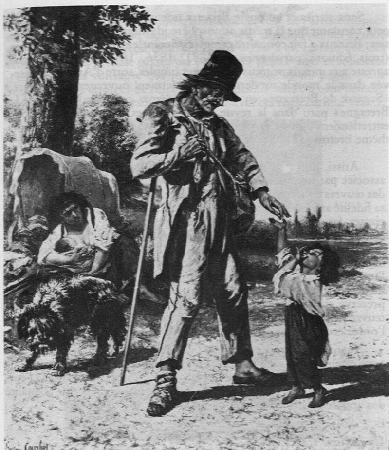
Fig. 12. — Courbet: «L'Aumône d'un mendiant à Ornans» (1868).

Basse Bretagne, commune de Brieç près de Quimper» de Prosper Saint Germain; certes, le pinceau manque de vie et de richesse dans cette abondante frise, mais le couple au sortir de l'église est représenté faisant l'aumône, les riches sont bons et les pauvres soumis et dignes, sujet moral et touchant prétexte à une galerie de costumes (57).