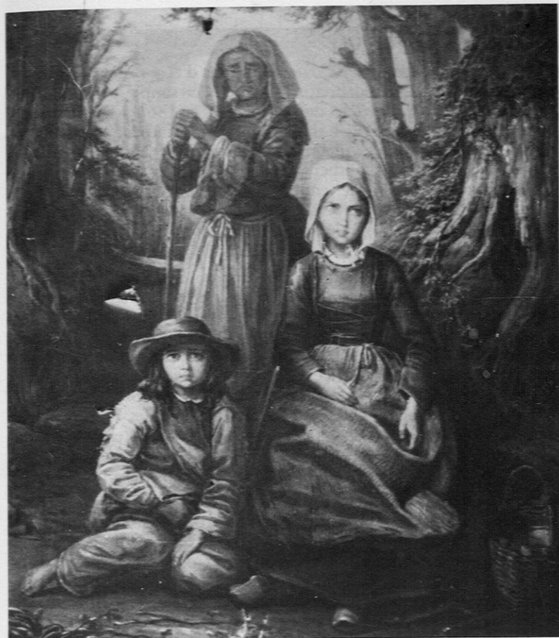
Fig. 14. — Félix Barret: «Mendiante avec deux enfants».

composé, subtilement confronté aux grandes références du passé. Jules Breton comme beaucoup en est convaincu: « On ne crée pas une œuvre véritable sans mettre de l'ordre dans sa création, écrit-il. Pour être durable elle ne doit pas être improvisée... La pochade promet tout, elle ne réalise rien. C'est le spectateur qui finit » (65). Le poids de ces convictions permet de mieux comprendre les difficultés de Courbet et de Manet puis, surtout, des impressionnistes.