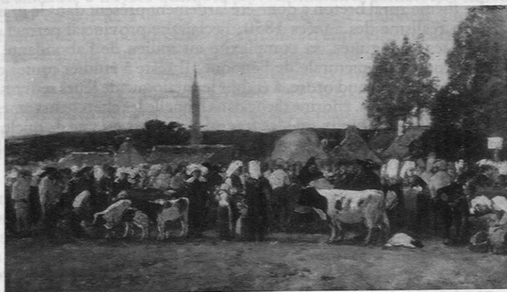
Fig. 16. — Eugène Boudin: «Jour de foire en Bretagne» (cliché the Corcoran Gallery of art, Washington).

assez exemplaire en ce domaine (70) (fig. 16); les costumes d'hommes et de femmes de Plougastel, Kerhuon, du Faou forment avant tout des taches de couleur disposées en frise, entre deux registres de repos visuel; Eugène Boudin échappe au folklore superficiel et son approche tient au fond d'une double démarche, celle du réaliste subjectif qui entend traduire un spectacle qu'il a observé et celle du réaliste optique dominée par le rendu des sensations colorées brutes.