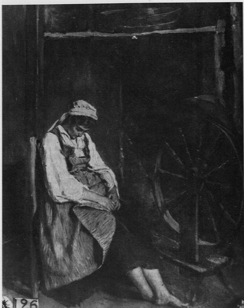
Fig. 6. — Alexandre Antigna: «La fileuse endormie» (1857?).

juste milieu. En 1852, alors que Courbet exposait «les Demoiselles de village» œuvre cependant considérée par plusieurs comme un signe de l'amendement du chef de l'école «ultra-réaliste», Maxime du Camp lui oppose les toiles de Luminais comme «le bon choix»: «si vous voulez