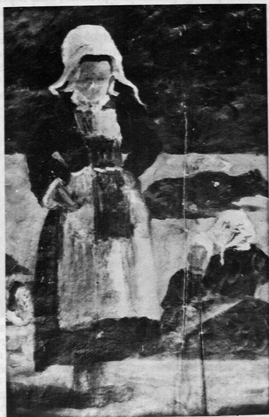
Fig. 15. — Paul Huet: «Fillette bretonne».

attaché n'empêche pas d'y retrouver les éléments caractéristiques de son style, solidité des formes, unité colorée, et lumineuse, sens des valeurs, inactivité pensive de ses personnages; réaliste certes cette œuvre l'est, «coin de la création vue à travers un tempérament» dira Zola vingt ans après.