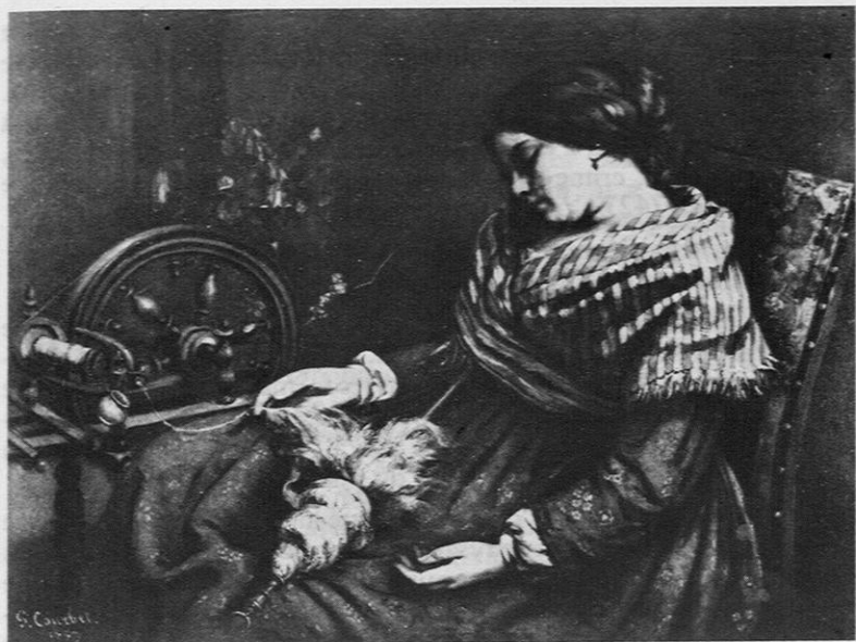
Fig. 7. — Courbet: «La Fileuse endormie» (1853).

en voir un (un réaliste), arrêtez-vous devant deux tableaux qui sont deux chefs d'œuvre et contemplez-les. Ils sont l'œuvre d'un homme qui mériterait d'avoir son nom pour surnom, M. Luminais; «les Pêcheurs de homards» et «le Berger breton» sont deux toiles sans prix; il serait bon d'être riche pour les couvrir d'or» (41). Même jugement du critique régional à Nantes: «Ce n'est pas à dire néanmoins que l'on puisse être un brin réaliste et faire cependant de beaux tableaux dignes de plaire aux honnêtes gens; voyez plutôt M. Luminais de Nantes»; celui-ci sait associer le charme au naturel (34).