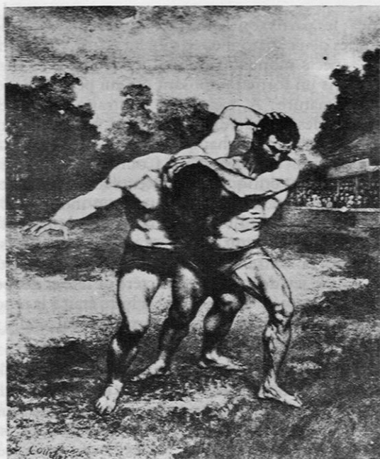
Fig. 10. — Courbet: «Les lutteurs» (1853).

promesses de la moisson que l'on va engranger dans la liesse à l'arrière plan; aucun nuage dans ce tableau qui veut dépasser le singulier et le régional pour rejoindre la tradition thématique des calendriers médiévaux (51).