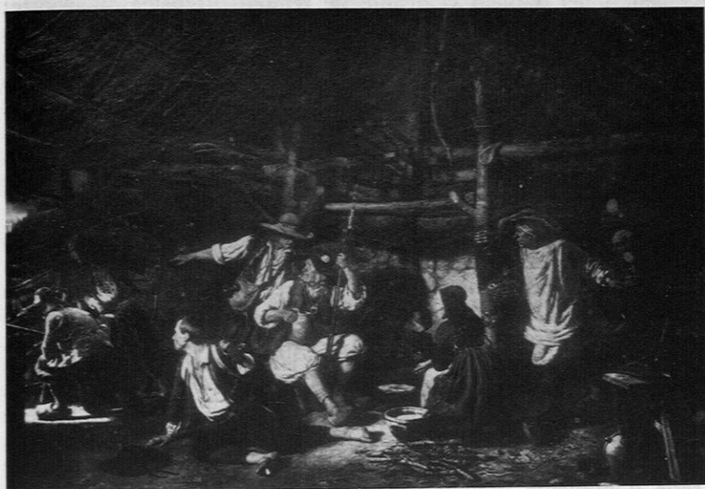
Fig. 1. — Charles Fortin: «Les Chouans» (1853)

recensement régional difficile à faire que ceux qui sont restés à l'atelier, nous révèlent au-delà des costumes la sévérité, la dureté, l'énergie des modèles, c'est-à-dire toute la dure condition paysanne d'alors. C'est parfois toute une famille qui pose dans un intérieur et le pinceau attentif à tout décrire avec précision ne privilégie cependant pas les hommes, aussi méticuleux à rendre le lit clos, le berceau, la cruche et la quenouille; des toiles comme «l'Intérieur breton» du même Goy sont des documents ethnographiques irremplaçables (16).