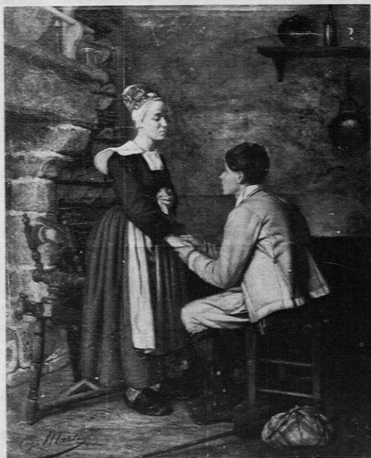
Fig. 13. — Eugène Martin: «Les Adieux».

sommairement à une définition traditionnelle, celle de l'artiste respectueux de l'enseignement donné par l'école et dominé par les grands préceptes affichés à l'Académie des Beaux-Arts, il est certain que des artistes, pour la plupart passés par l'école des Beaux-Arts et soucieux d'emporter les suffrages des jurys pour exposer et du public pour vendre, vont s'efforcer de respecter les règles admises du bien peindre (tandis que les fortes personnalités vont braver ces règles et innover...).