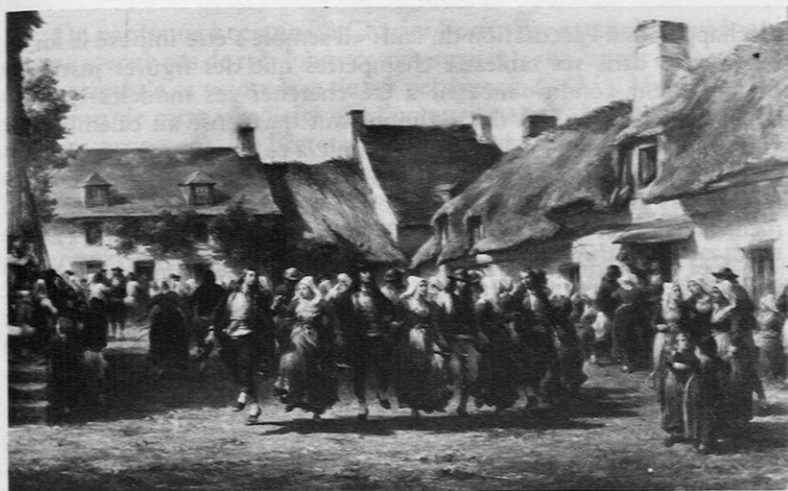
Fig. 3. — Adolphe Leleux: «Une noce en Bretagne» (1863), (cliché Musée de Quimper).

chez Casimir Perier; Napoléon III l'avait beaucoup apprécié et avait décidé l'acquisition de plusieurs de ses toiles (28).