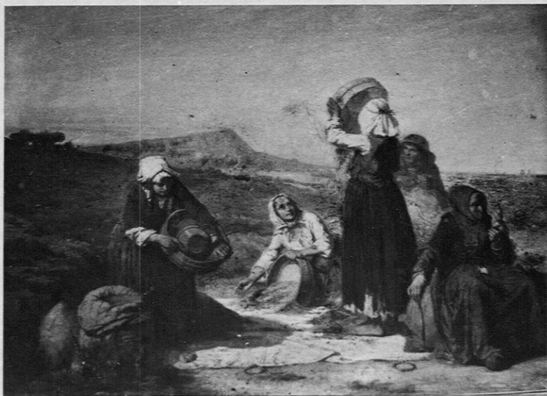
Fig. 8. — Félix Roy: « Les Vanneuses » (1867) (cliché D. Delouche).

Mis à part les thèmes des métiers (forgerons, sabotiers, bûcherons), les scènes de travail sont de préférence féminines: les activités domestiques sont volontiers peintes dans des intérieurs précisément décrits mais les travaux des champs se résument en quelques images de faneuses et de vanneuses. En 1867, Félix Roy professeur de dessin à l'école des Beaux-Arts de Rennes, expose « les vanneuses » à Paris (fig. 8): la composition légèrement dissymétrique est soigneusement