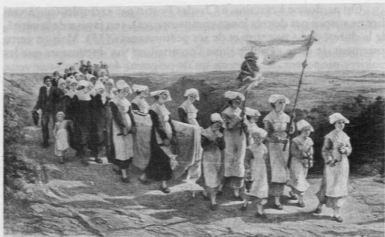
Fig. 4. — Amédée Guérard: «Le convoi d'une jeune fille se rendant à l'église de Monterfil» (1861).

pagnes aux yeux battus de la jeune morte; quant à la peinture, à l'opposé de la pâte épaisse, des traces du couteau, de la matière largement travaillée qui font la richesse plastique chez Courbet, Guérard travaille dans une matière économe avec soin et précision. Les qualités réalistes de l'observation sont incontestables, expressions diverses et discrètes de la douleur, description juste des costumes sans excès de pittoresque; la simplicité de la composition du convoi qui se déroule dans un paysage plat et dénudé, la lumière matinale rasante qui éclaire les ombres sans aviver les couleurs s'y conjuguent pour justifier les critiques qui en soulignent la « poésie touchante », la « naïveté et même le charme » ce qui n'empêche pas certains autres de juger encore que le peintre puise ses modèles dans « la grosse paysannerie » (39).