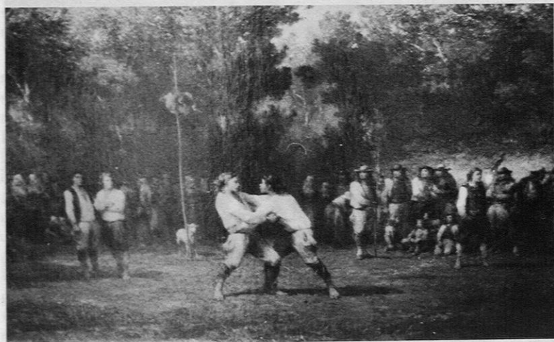
Fig. 9. — Adolphe Leleux: «Lutteurs en Basse Bretagne» (1864).

Nos peintres, ignorant peut-être ou dédaignant les orientations préconisées par Max Buchon et les objurgations de Proudhon («peindre les hommes dans la sincérité de leur nature et de leurs habitudes, dans leurs travaux, dans l'accomplissement de leurs fonctions civiques et domestiques... tel me paraît être à moi le vrai point de départ de l'art moderne»), plus attentifs aux préférences du public acquéreur éventuel de leurs œuvres, ont préféré des sujets souriants aux sujets austères; les critiques hostiles par inquiétude sociale au réalisme pouvaient d'ailleurs les en détourner... Peu ont le courage et la persévérance d'un Millet. Aussi les thèmes les plus fréquents sont-ils les jeux, les distractions, les fêtes de la cellule familiale ou villageoise, ou encore les rassemblements à motivations économiques (foires, marchés) ou religieuses (messes, vêpres, pardons).