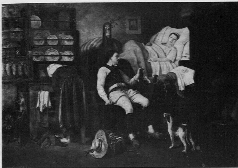
Fig. 2. — Eugène Leroux: «Le Nouveau-né, intérieur breton».

des particularités régionales, c'est le thème traditionnel de la nativité qui est repris dans le monde rural contemporain; les critiques ne mettent pas en doute la véracité du document: en 1868 à propos d'un «Ensevelissement intérieur breton», le chroniqueur de la Gazette des Beaux-Arts écrit: «L'habitation bretonne dont M. Eugène Leroux connaît si bien les patriarcales habitudes lui sert de cadre à une scène de douleur vraiment sincère et recueillie, dans le lit à volets on entrevoit la figure pâlie du mort qui apparaît au-dessus de toute une assistance à genoux; les plis lourds des jupes en grosse étoffe tombent avec une sorte de solennité. M. E. Leroux a vu là non point seulement le côté anecdotique et singulier des mœurs bretonnes, mais il en a su rendre l'antique et grand caractère» (19).