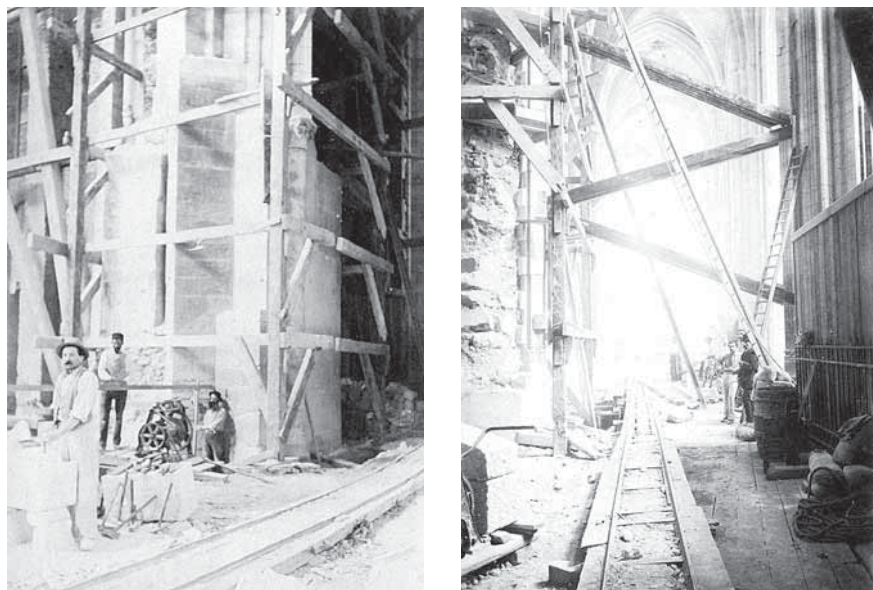
Figures 3 et 4 – Photographies prises lors de la dernière phase de l'achèvement de la cathédrale (entre 1887 et 1891) (Arch. dép. Loire-Atlantique, 47 Fi, album ayant appartenu à l'architecte Legendre)