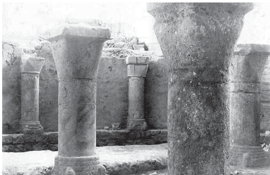
Figure 5 – Photographie de la crypte après les déblaiements de 1884-1885