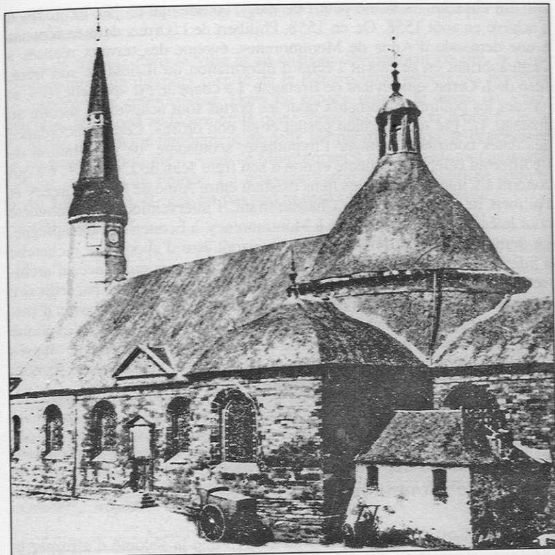
Figure 3 – La chapelle Saint-Nicolas peu avant sa démolition en 1881. La nef est allongée et surmontée d'un nouveau clocher en 1842-1844.