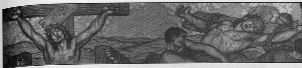
Lannion, chapelle Saint-Joseph, le chemin de croix : la mise en croix et le Christ crucifié entre les larrons.