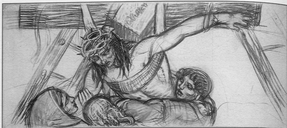
La descente de croix , fusain sur papier craft, 110-250 cm. Photo Gaëtan de Langlais - Collection privée.