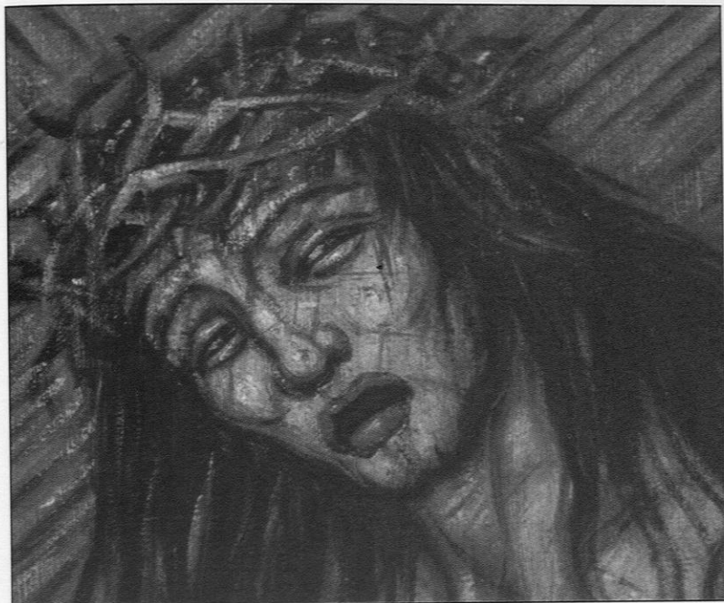
Lannion, chapelle Saint-Joseph, le chemin de croix : visage du Christ portant la croix, détail.

Remarquons que Xavier de Langlais met en scène une tragédie strictement humaine (il n'y a aucun nimbe), ce qui contribue sans doute à la force communicative de l'image.