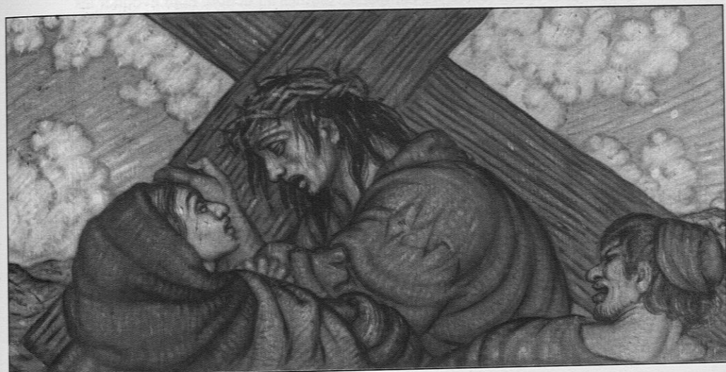
Lannion, chapelle Saint-Joseph, le chemin de croix : rencontre avec Marie.