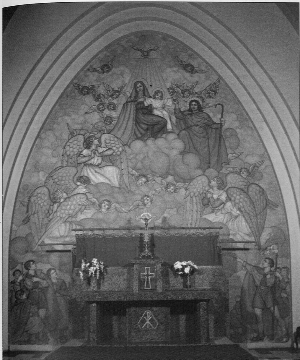
Lannion, chapelle Saint-Joseph, l'hommage des scouts à la Vierge, ensemble.