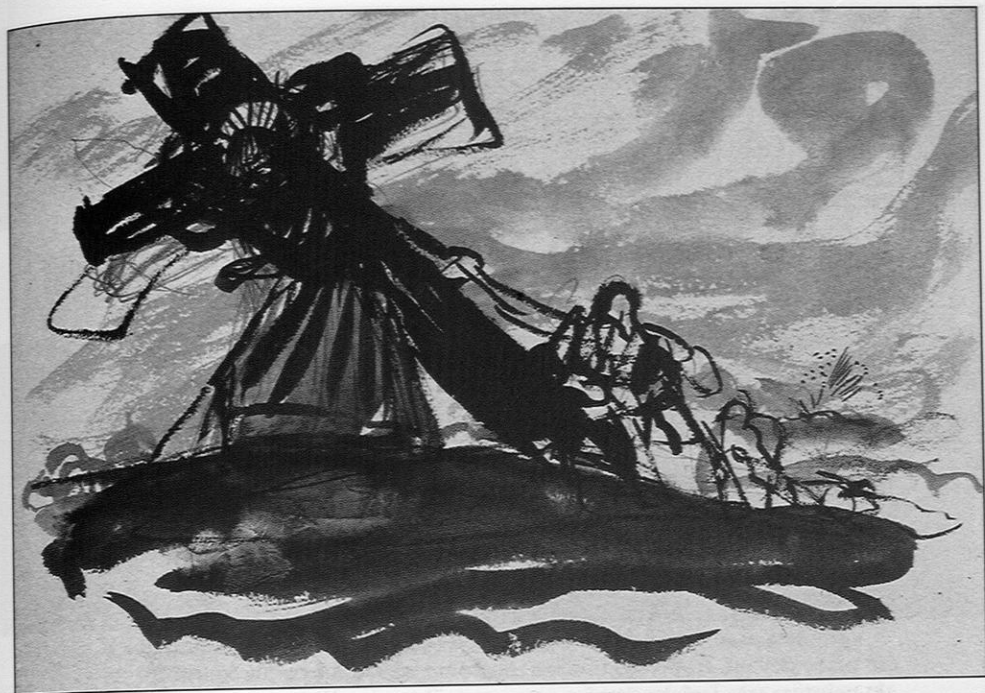
Le portement de croix, encre sur papier, 14,5-21 cm.

Georges Desvallières (1861-1950), le fondateur, avec Maurice Denis, de l'Atelier d'art sacré, en 1919. Il présentera au jury la treizième station du chemin de croix de Lannion (4 avril) 22 .