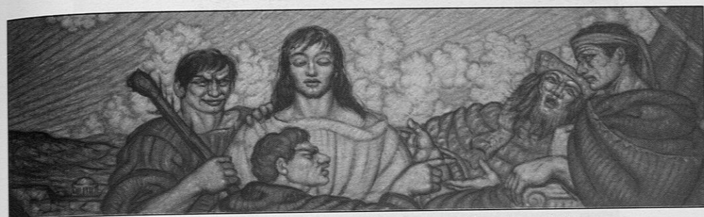
Lannion, chapelle Saint-Joseph, le chemin de croix : Jésus devant Pilate.